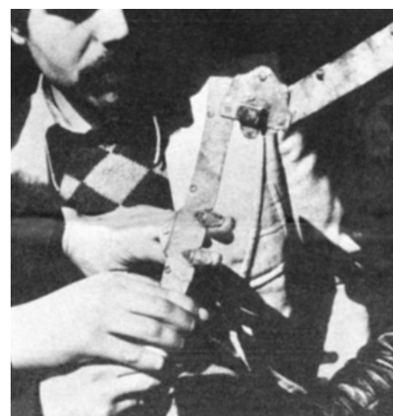
Artefacto de tortura utilizado por la policía secreta iraní (apuntalado por Estados Unidos) para sacar uñas.

2 Entre 1953 y 1979, Estados Unidos fue la potencia dominante en Irán. ¿Aprovechó su posición para mejorar la vida de la población? No. La vida bajo la dominación yanqui fue una pesadilla. El sha gobernó el país con mano de hierro por medio de la odiada policía secreta, SAVAK, que Estados Unidos entrenó y organizó. SAVAK arrestó, torturó y asesinó a grandes cantidades de iraníes que se oponían al gobierno. El sha forjó una economía al servicio del Occidente y gastó miles de millones de dólares para convertir el país en un puesto de avanzada militar estadounidense. Por su parte, el 60% de la población era analfabeta, la esperanza de vida era solamente 50 años, 139 de cada mil niños morían antes del primer año de vida y millones vivían en la pobreza en el campo y en las enormes barriadas urbanas.