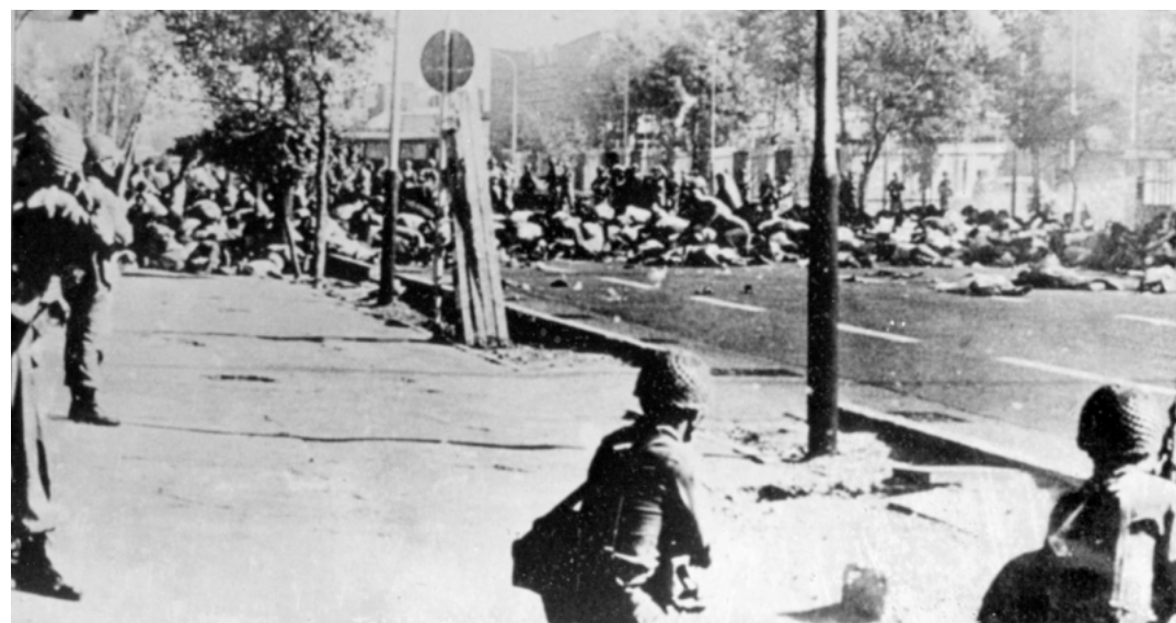
"Viernes sangriento": Las tropas del sha masacran a miles de manifestantes antigubernamentales, septiembre de 1978.