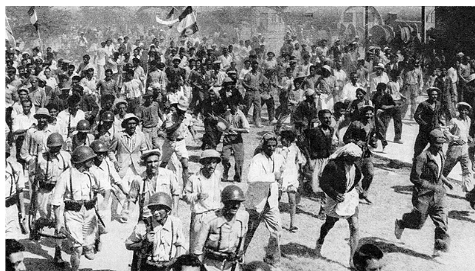
Protesta contra la dominación inglesa, 1951.

Surgió un movimiento de millones de personas que corrió del país al odiado sha. Mohamed Mossadegh se hizo primer ministro e intentó nacionalizar el petróleo. Controlar el petróleo iraní fue un elemento crucial de sus imperios globales. En 1953, la CIA e Inglaterra organizaron un golpe de estado que tumbó a Mossadegh y volvió a instalar en el poder al sha, aplastó la oposición e impuso una brutal dictadura. Volvieron a privatizar el petróleo y entregarlo a las compañías petroleras occidentales.