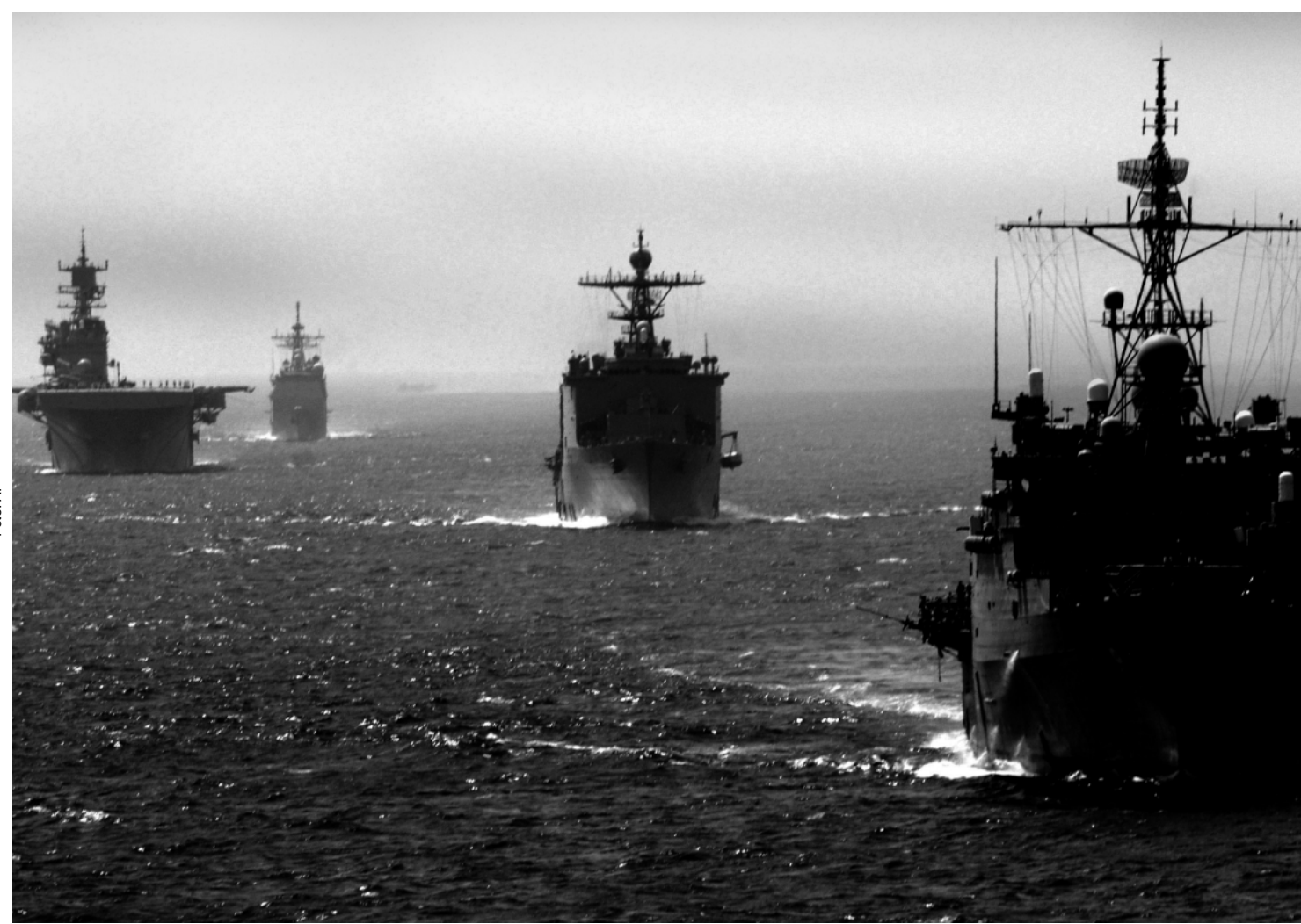
Buques de guerra yanquis en ejercicios en el golfo Pérsico, junio de 2007.

El gobierno de Bush ha hecho muchas acusaciones contra Irán como pretexto para sus amenazas de agresión. Pero estos son los mismos mentirosos comprobados que fraguaron la patraña de las "armas de destrucción masiva" para invadir a Irak, y no se debe aceptar como verdad nada de lo que digan. Pero, aun si fuera cierto todo lo que Estados Unidos dice sobre Irán: que ayuda a las fuerzas en Irak que están matando sus soldados, que es una teocracia islámica opresiva, que tiene aspiraciones de ser una potencia nuclear... nada de eso cambiaría que un ataque estadounidense contra Irán sería AGRESIÓN IMPERIALISTA.