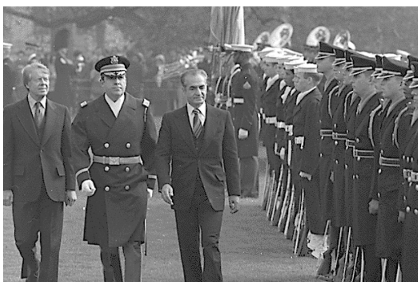
Sha de Irán visita al presidente estadounidense Jimmy Carter, noviembre de 1977.

3 En 1978 una ola de revolución popular sacudió el país en oposición al sha. Estados Unidos apoyó las medidas del sha para ahogar la revolución en sangre: por ejemplo, la masacre de miles de manifestantes en septiembre de 1978, el "Viernes sangriento". Cuando se hizo evidente que el sha perdía el control, Estados Unidos recurrió a otras tácticas. Obligó al sha a exiliarse y ayudó al reaccionario gobierno fundamentalista islámico dirigido por el ayatola Jomeini a consolidar el poder e iniciar una nueva pesadilla para el pueblo iraní. El gobierno estadounidense pensaba que podía gobernar por medio de la República Islámica porque los teócratas no querían ni podían romper decisivamente con el imperialismo. Además, Estados Unidos apoyó la salvaje represión del gobierno islámico contra los revolucionarios y progresistas.