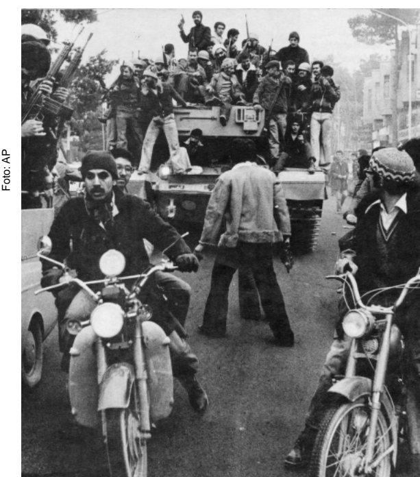
Arriba: Manifestantes se apoderan de tanque durante levantamientos populares contra el sha, 1979.

4 El gobierno de Jomeini estaba empeñado en fomentar el fundamentalismo islámico y extender su influencia en la región. En noviembre de 1979 Jomeini alentó a estudiantes islámicos a apoderarse de la embajada estadounidense en Teherán. Esto chocó fuertemente con los esfuerzos de Estados Unidos para mantener su dominación del Medio Oriente. Así que en 1980, Washington le dio a Saddam Hussein de Irak una luz verde para invadir a Irán y luego convirtió la guerra entre Irán e Irak en un baño de sangre que duró ocho años. Los aliados yanquis le dieron a Hussein miles de millones de dólares de armas y los materiales para construir armas químicas, con que atacó a Irán (y a los curdos iraquíes). Estados Unidos también le dio armas a Irán. Ayudó a ambos lados para impedir una victoria. Cuando por fin terminó la guerra, unos 367,000 iraquíes e iraníes estaban muertos y otros 700,000 heridos.