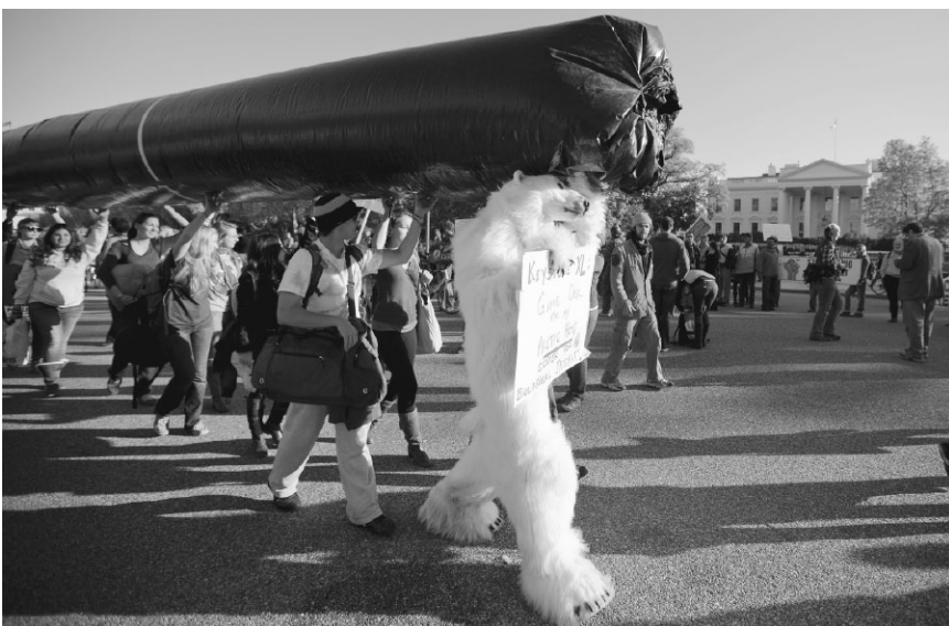
Unos manifestantes sostienen una réplica del oleoducto de Keystone XL en una protesta por el creciente flujo de petróleo de las arenas de alquitrán, Alberta, Canadá.