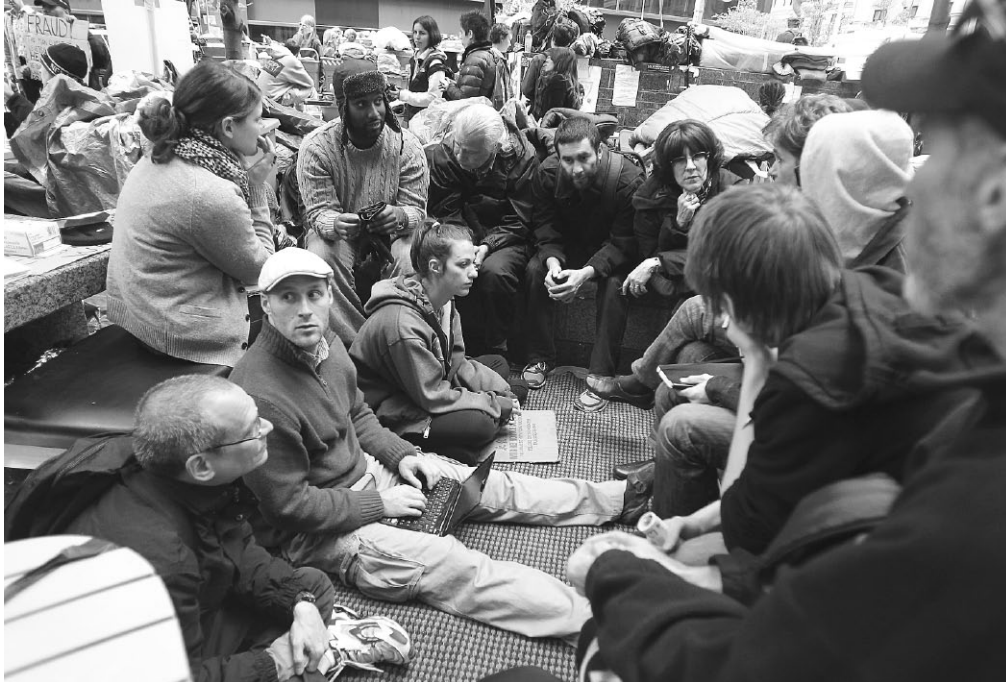
Ocupar Wall Street: Los grupos de trabajo se reunieron a lo largo del día para discutir planes.