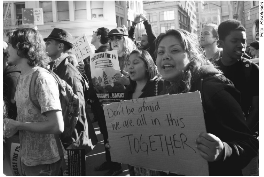
Marcha de Ocupar Oakland el día del paro.