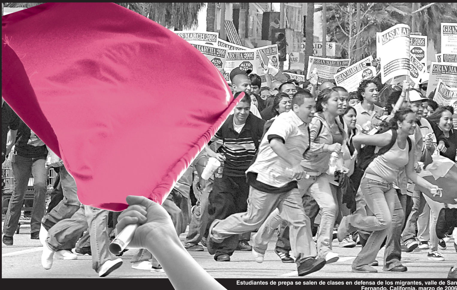
Estudiantes de prepa se salen de clases en defensa de los migrantes, valle de San Fernando, California, marzo de 2006