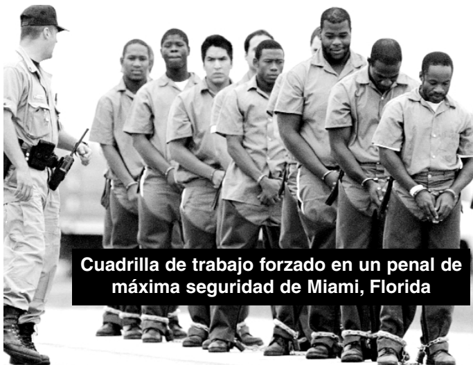
Cuadrilla de trabajo forzado en un penal de máxima seguridad de Miami, Florida