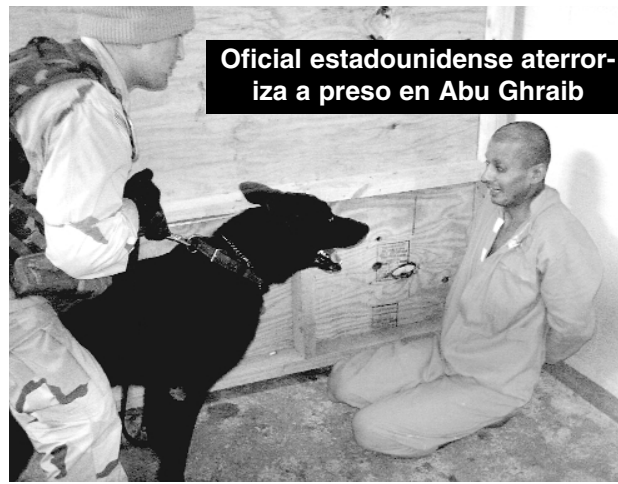
Oficial estadounidense aterroriza a preso en Abu Ghraib