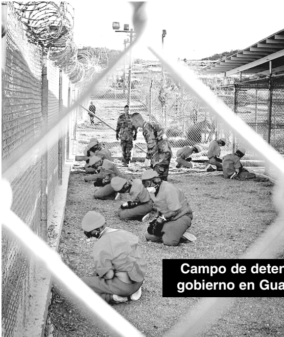
Campo de detención del gobierno en Guantánamo