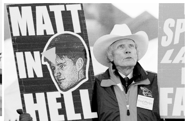
Fascista cristiano frente al palacio de justicia durante el juicio de uno de los hombres que asesinó a Matthew Shepard por ser gay

Letrero en biblioteca de Santa Cruz que advierte del espionaje del FBI El letrero dice: Aunque la biblioteca de Santa Cruz hace todo lo posible para proteger la privacidad, la LEY PATRIOTA (Public Law 107-56), una ley federal, permite que los agentes federales obtengan la lista de los libros y otros materiales de lectura que ha sacado de esta biblioteca. Esa ley federal prohíbe que los empleados de la biblioteca le digan si un agente federal ha obtenido esa información.