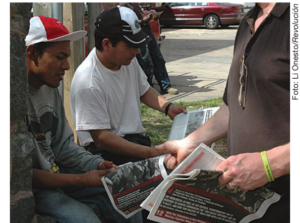
Migrantes en Nueva Orleans, 2006.