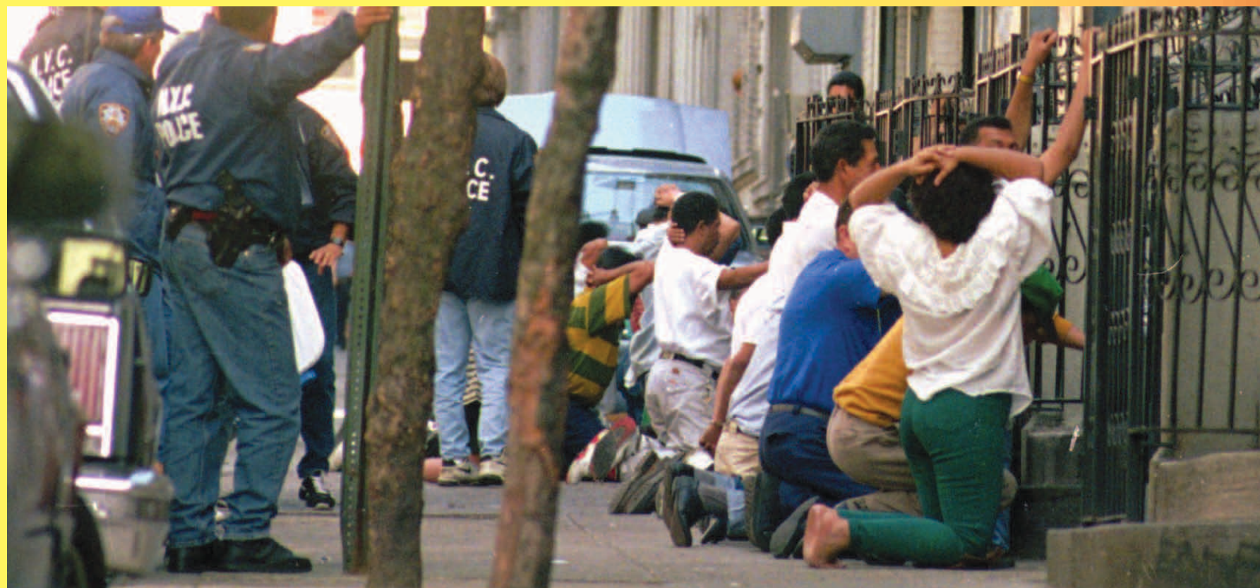
Arrestos en masa, calle 162, Washington Heights, Nueva York, parte de la "Guerra contra las drogas".

Veamos a las personas en estas fotos. Figuran entre los millones en este país, sobre todo hombres jóvenes negros, que han estado en la mira de la "guerra contra las drogas". De 1980 al 2006, el número de presos en Estados Unidos subió en 450%, a 2.3 millones. Estados Unidos tiene más personas encarceladas hoy que ningún otro país en el mundo. Un 40% de dichos presos son afroamericanos, aunque constituyen solamente el 13% de la población general de Estados Unidos. El índice de encarcelamiento de los negros es seis veces el de los blancos.