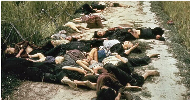
Aldeanos en My Lai, Vietnam, masacrados por soldados de Estados Unidos, 16 de marzo de 1968.

Estados Unidos envió más de 500.000 soldados y soltó millones de toneladas de bombas con el fin de derrotar la lucha de liberación nacional del pueblo vietnamita. Para cuando la guerra terminó en la derrota de Estados Unidos en abril de 1975, su ejército ya había masacrado a unos dos millones de civiles y un millón de soldados vietnamitas. Durante la guerra, Estados Unidos también bombardeó a los pequeños países vecinos de Laos y Camboya, con un saldo de cientos de miles de muertes.