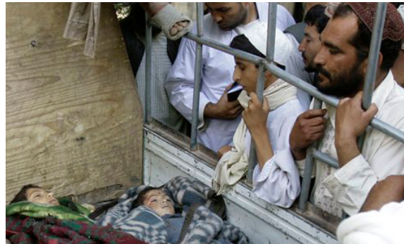
Niños asesinados en la guerra aérea de Estados Unidos en Afganistán, 2009.

En 2001, fuerzas de Estados Unidos invadieron a Afganistán, sacaron del poder al régimen fundamentalista islámico del Talibán e instalaron una "República Islámica" pro estadounidense