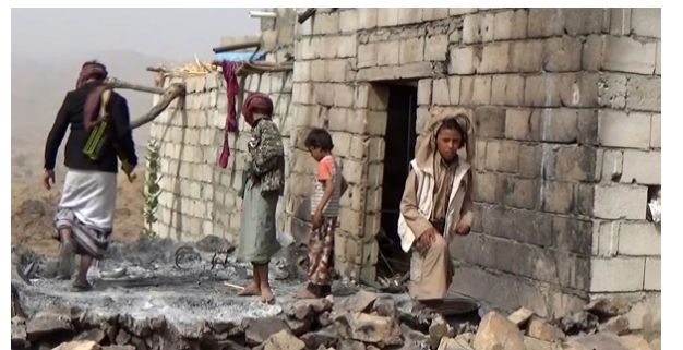
Ataque aéreo saudí con respaldo de Estados Unidos a Yemen, 2015.

En marzo de 2015, Arabia Saudita, con el apoyo de Estados Unidos, lanzó una guerra contra el movimiento hutí de Yemen. Desde entonces, más de 150.000 personas han resultado muertas. Los saudíes han bombardeado los sistemas de alimentos, agua y atención sanitaria de Yemen, causando hambre y enfermedades masivas. Como resultado, hasta 400.000 niños han muerto de hambre.